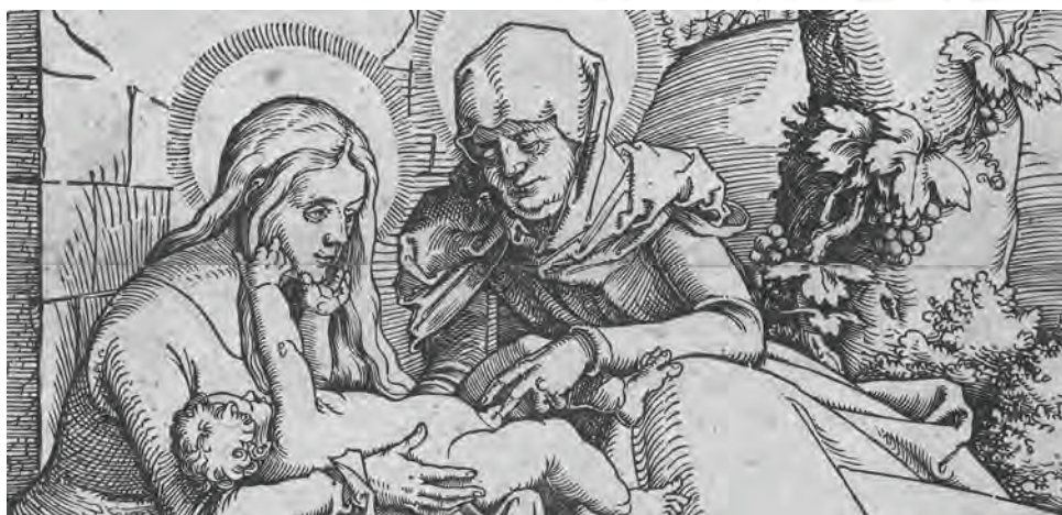
Maria en kind met Anna, Hans Baldung Grien, 1511 (detail); houtsnede Rijksmuseum