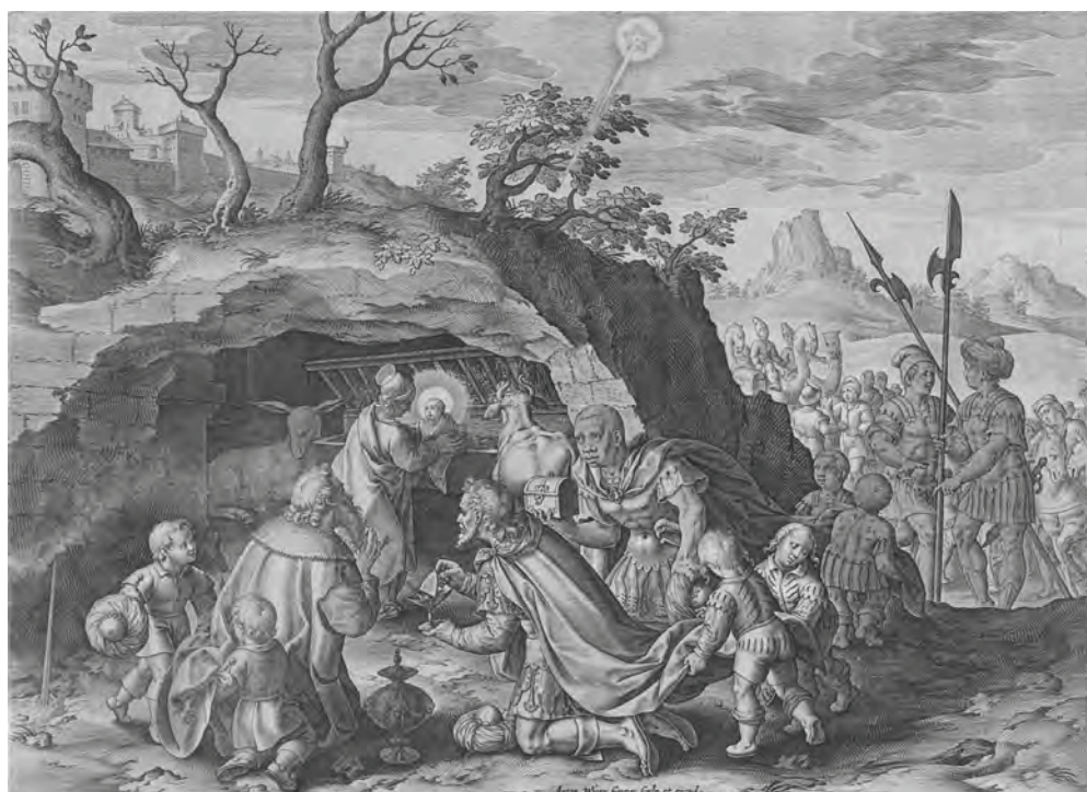
Aanbidding door de koningen, Antonie Wierix (II), 1565 - voor 1604; gravure