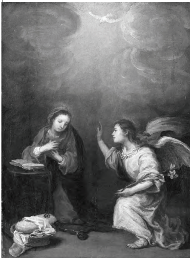
De verkondiging aan Maria, Bartolomé Esteban Murillo, 1700 - 1800, (olieverf op paneel, Rijksmuseum)