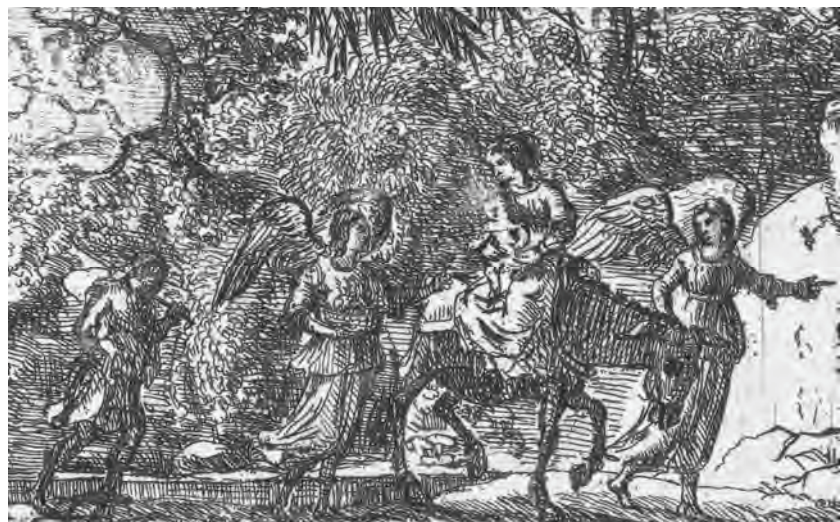
Vlucht naar Egypte, Claude Gellée (genaamd Le Lorrain), 1630 - 1633; ets Rijksmuseum

Meer informatie over deze tentoonstelling: catharijneconvent.nl