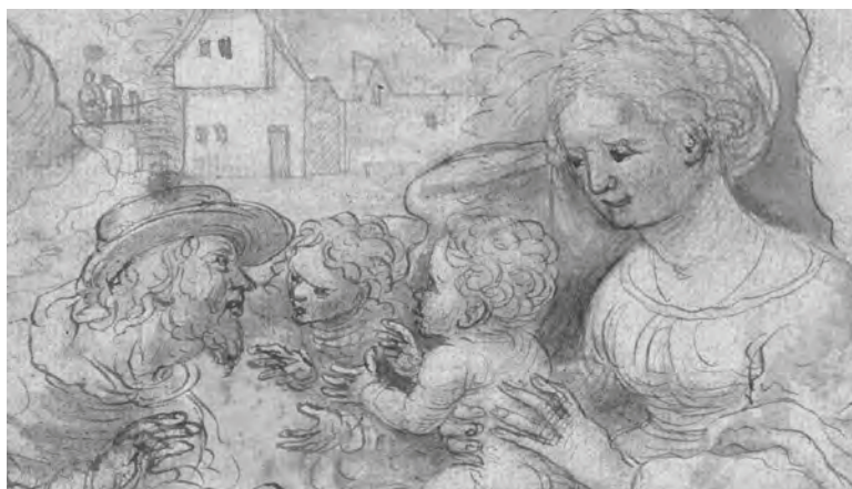
Maria met kind, Jozef luistert naar een engel, Jacob Cornelisz van Oostanen, naar Pieter Coecke van Aelst, 1500 - 1510 (detail)

pen in lichtbruin en grijs, penseel in groen en rood