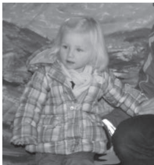
Onze toekomstige musicalster