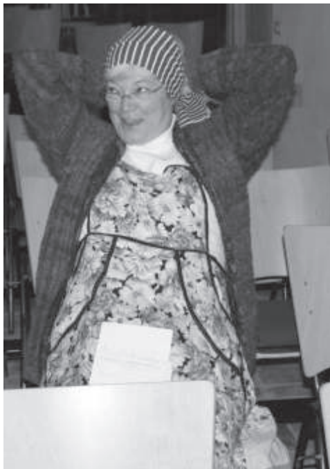
Moeder is nu al uitgeteld